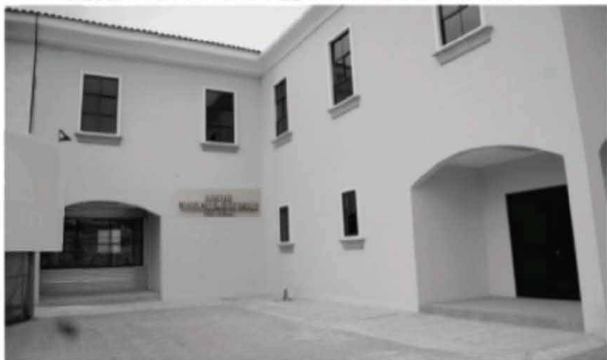
SEDE ALTERNA EN LA PARROQUIA URBANA SATÉLITE LA AURORA