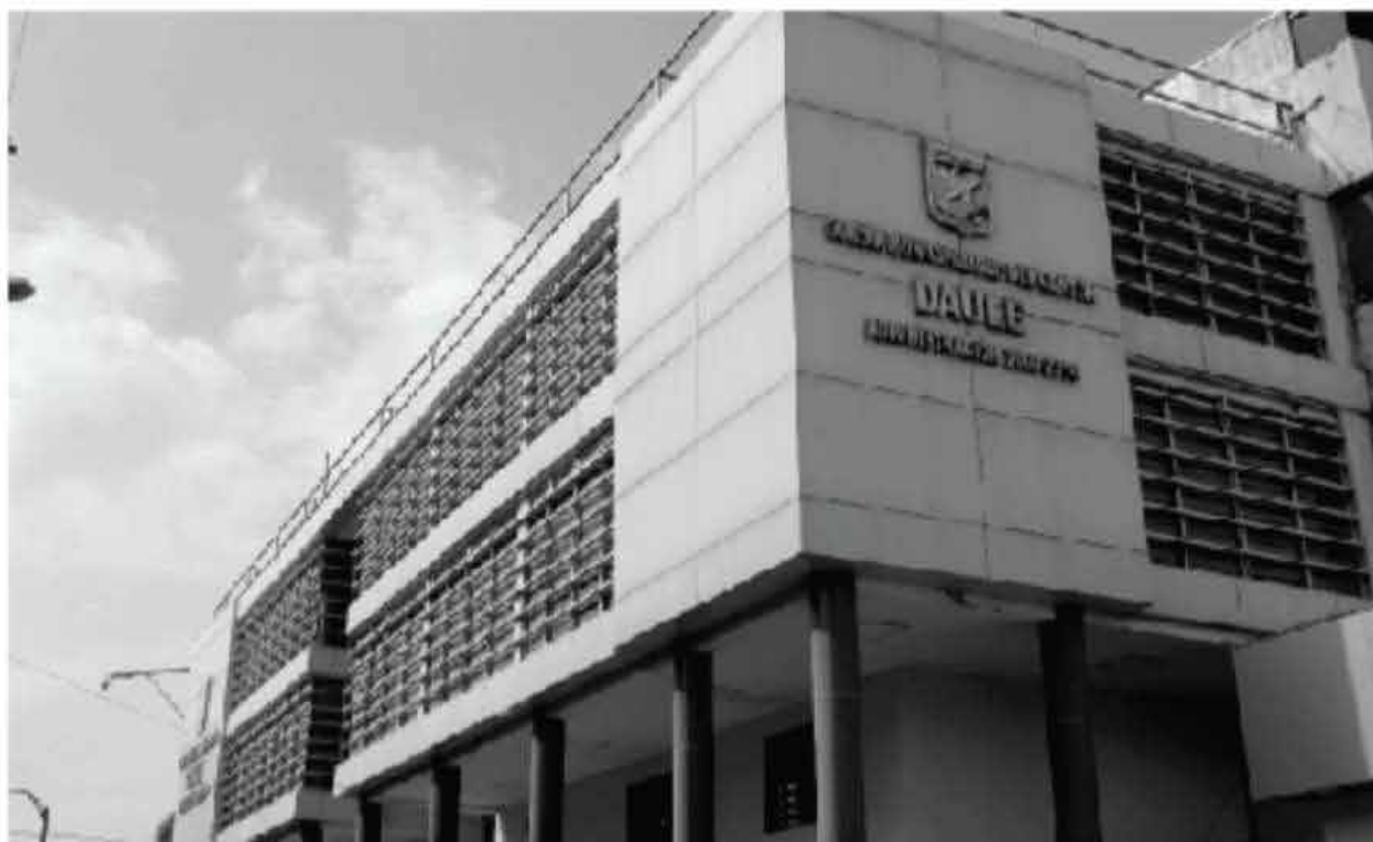
SEDE PRINCIPAL EN EL CENTRO DE LA CIUDAD