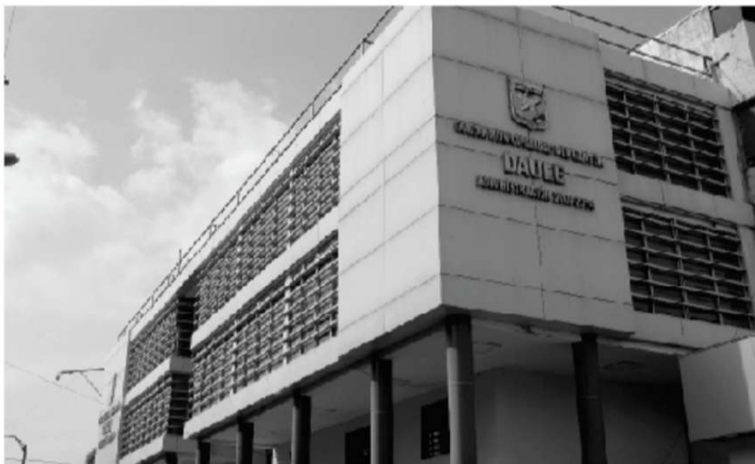
SEDE PRINCIPAL EN EL CENTRO DE LA CIUDAD