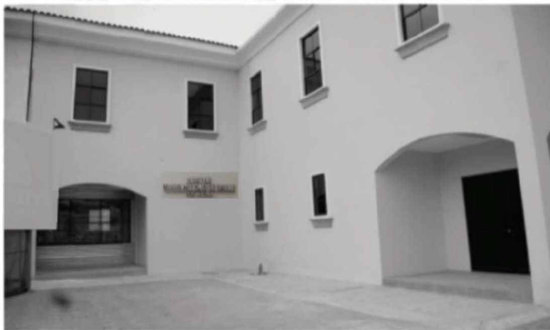
SEDE ALTERNA EN LA PARROQUIA URBANA SATÉLITE LA AURORA