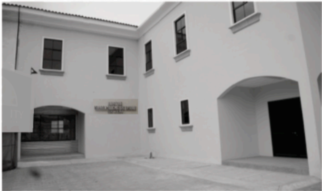
SEDE ALTERNA EN LA PARROQUIA URBANA SATÉLITE LA AURORA