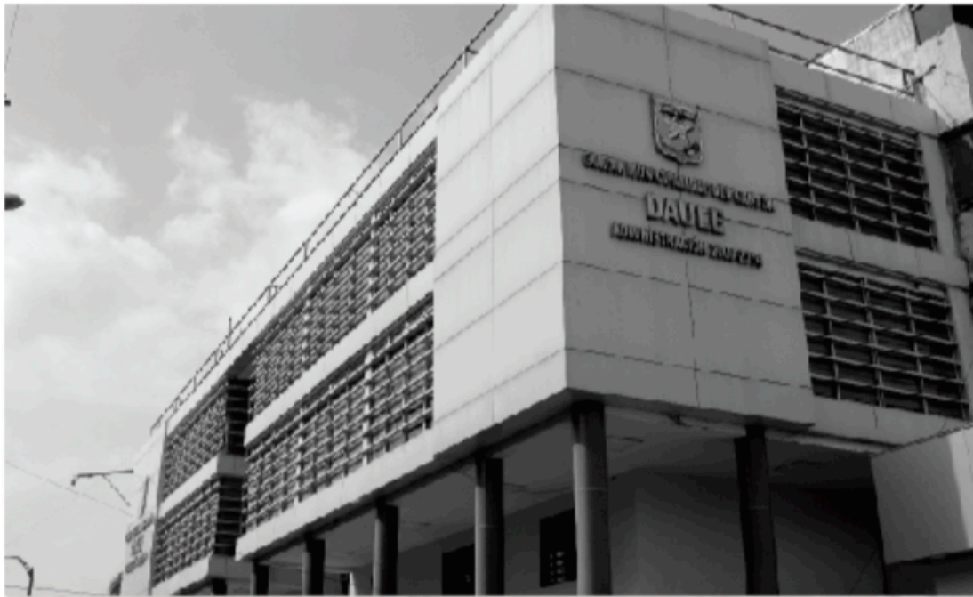
SEDE PRINCIPAL EN EL CENTRO DE LA CIUDAD