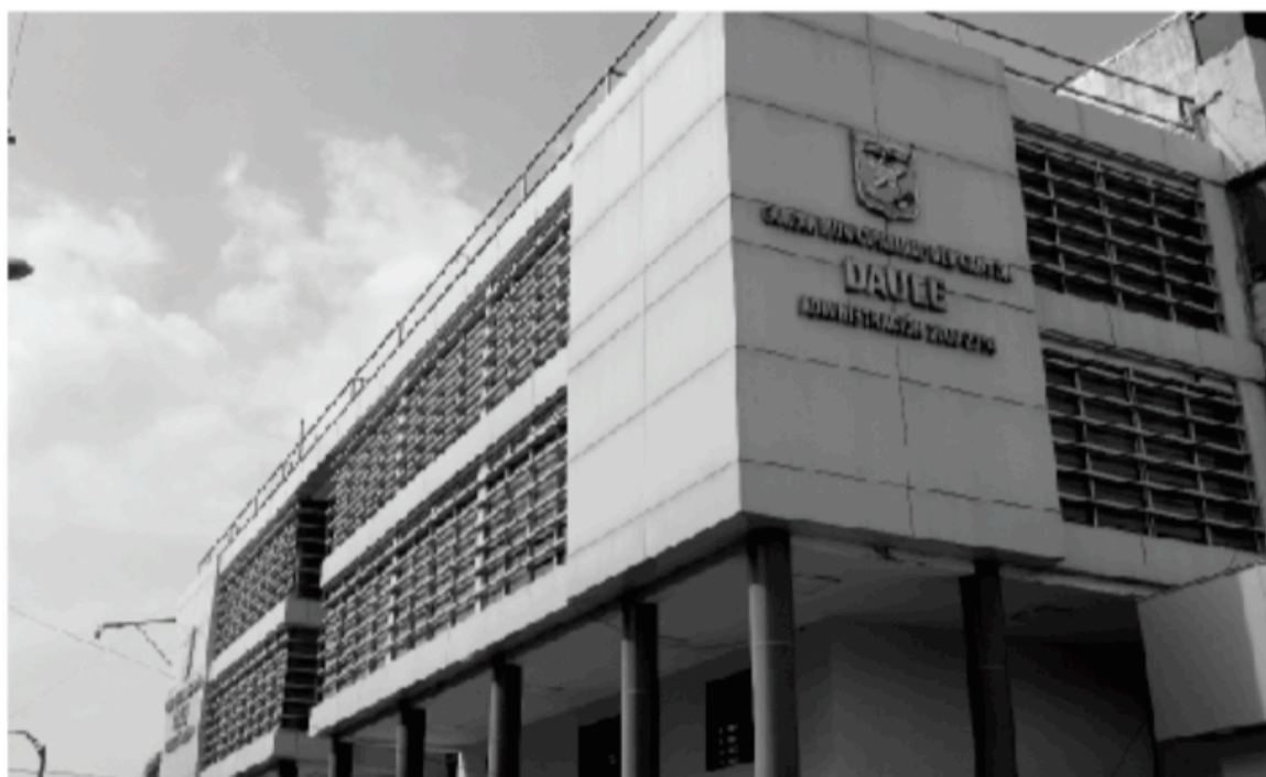
SEDE PRINCIPAL EN EL CENTRO DE LA CIUDAD