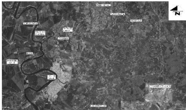
Mapa de Ubicación

De acuerdo a lo establecido en el certificado de intersección MAE-SUIA-RA-CGZ5-DPAG-2017-217664 - Península de Animas, MAE-SUIA-RA-CGZ5-DPAG-2017-217654 - Brisas de Daule, MAE-SUIA-RA-CGZ5-DPAG-2017-217659 - Flor de María, MAE-SUIA-RA-CGZ5-DPAG-2017-217651 - Pueblo Nuevo, MAE-SUIA-RA-CGZ5-DPAG-2017-217647 - Yurima Norte y MAE-SUIA-RA-CGZ5-DPAG-2017-217652 - Yurima Sur emitido por el Ministerio del Ambiente el proyecto No Intersecta, con el Sistema Nacional de Áreas Protegidas (SNAP), Bosques y Vegetación Protectora (BVP) y Patrimonio forestal del Estado (PFE)